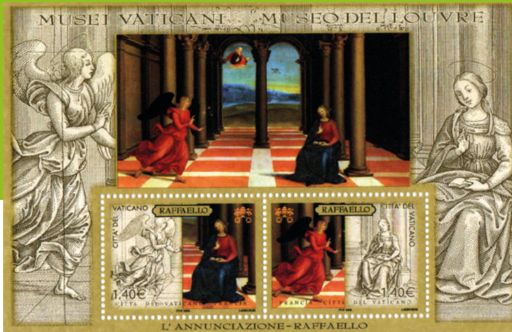
Francobolli emessi dalle Poste della Città del Vaticano nel 2005, stampati in foglietto, con vignetta dedicata all'Annunciazione di Raffaello.

Il Sodalizio è attivo dal 1992 e ha sede in Tirano, Via Lungo Adda Ortigara 10 - Tel. 0342 703059